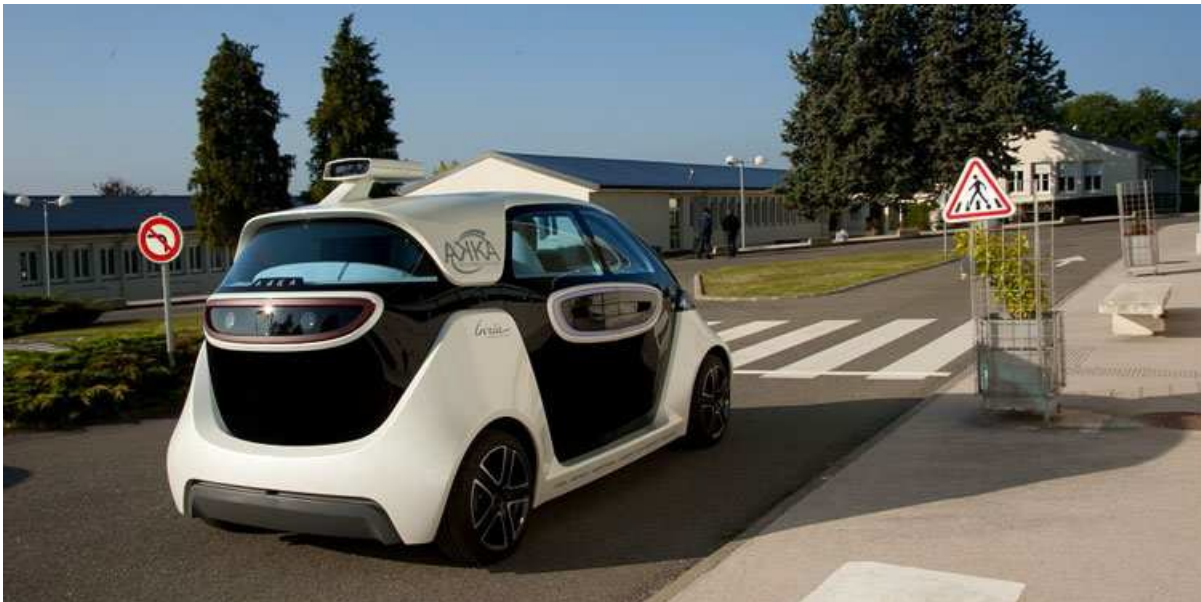
Link&Go, véhicule électrique intelligent bi-mode pouvant se conduire et se garer avec ou sans conducteur, fruit de la collaboration Inria - AKKA Technologies.

Au moment de la COP21, on peut se demander à juste titre quelle sera la place de la voiture dans la ville du futur. On voit en effet se multiplier les annonces sur la réduction de l'espace pour circuler, la suppression de places de parking, les péages urbains, l'interdiction des 4x4, etc. Pourquoi tant d'animosité envers ce merveilleux outil de liberté que chacun désire dès son plus jeune âge ?